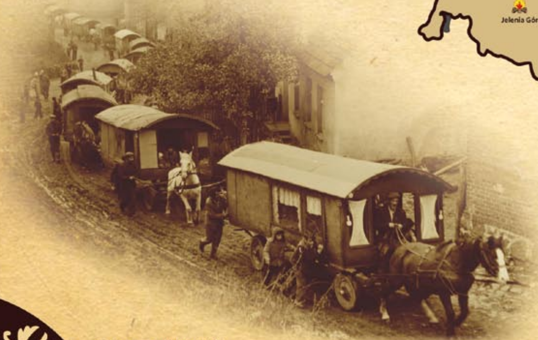
Tabor cygański, 1963 r.