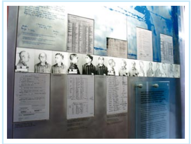
Wystawa w Muzeum Auschwitz-Birkenau upamiętniająca zagładę Romów w czasie II wojny światowej.