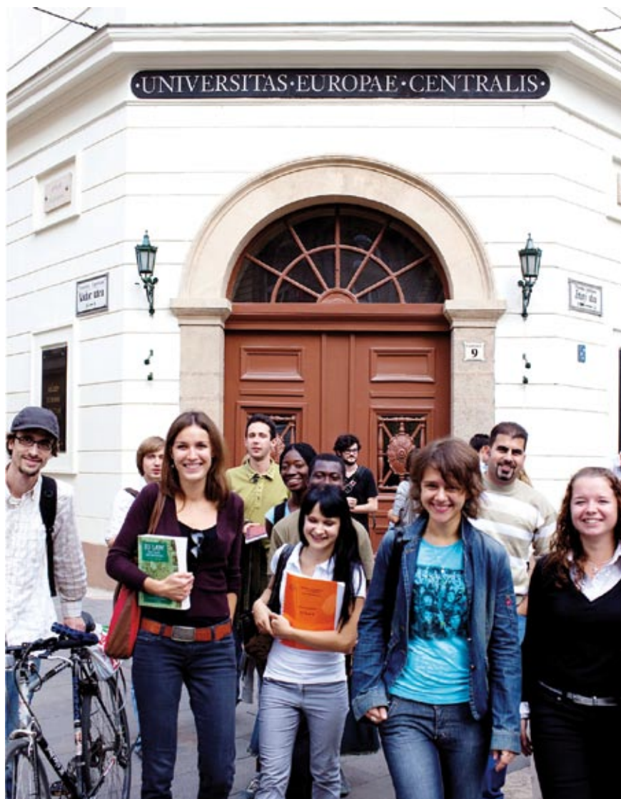
Studenci z CEU przed głównym wejściem na uniwersytet w Budapeszcie.

Rok akademicki w ramach RGPP trwa od września do połowy czerwca. Jest to program w pełnym wymiarze godzin, a studenci powinni przebywać w Budapeszcie lub w Wiedniu przez cały czas trwania wszystkich semestrów. Wszyscy