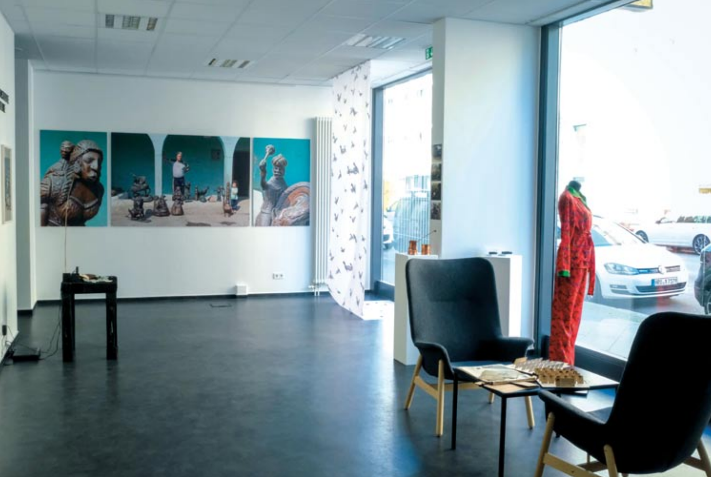
Wystawa dre cyklo „Zor i odporność Romengry” dre galeria ERIAC dre Berlin.