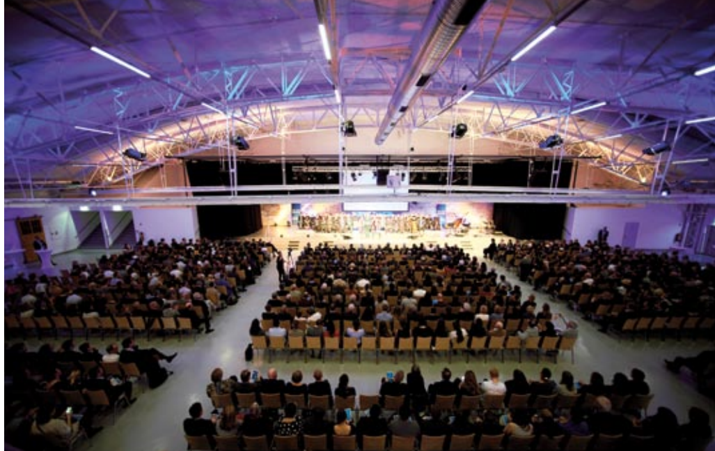
Uroczysto inauguracja Uniwersyteto Maškirałeuuropejsko dre Wiednio dre 2019 berś.

Paś Programo pał Studia Romane isy kerde też pherdo vavirchane wydarzeni save organizowana isy pe bieżąco, pał