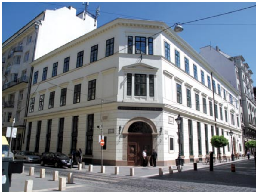
Vdziapen ke siedziba Uniwersytetu Mańskirałeuropejsko dre Budapeszto.