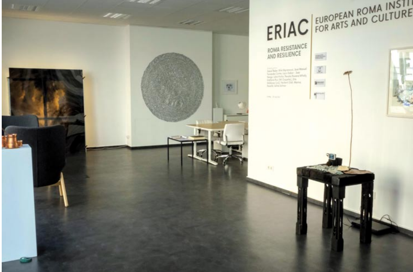
Wystawa z cyklu „Opór i odporność Romów” w galerii ERIAC w Berlinie.