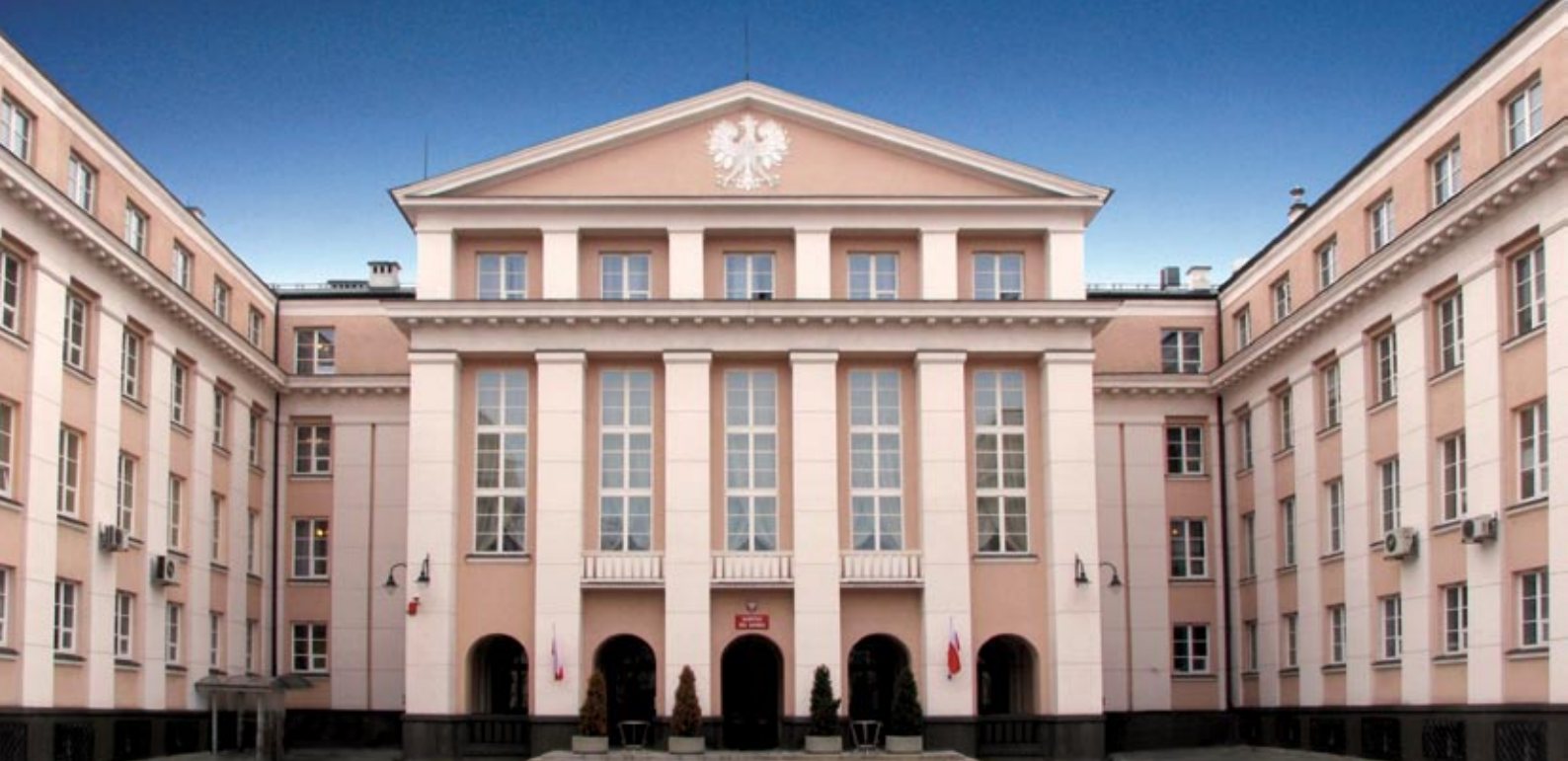
Siedziba NIK od frontu