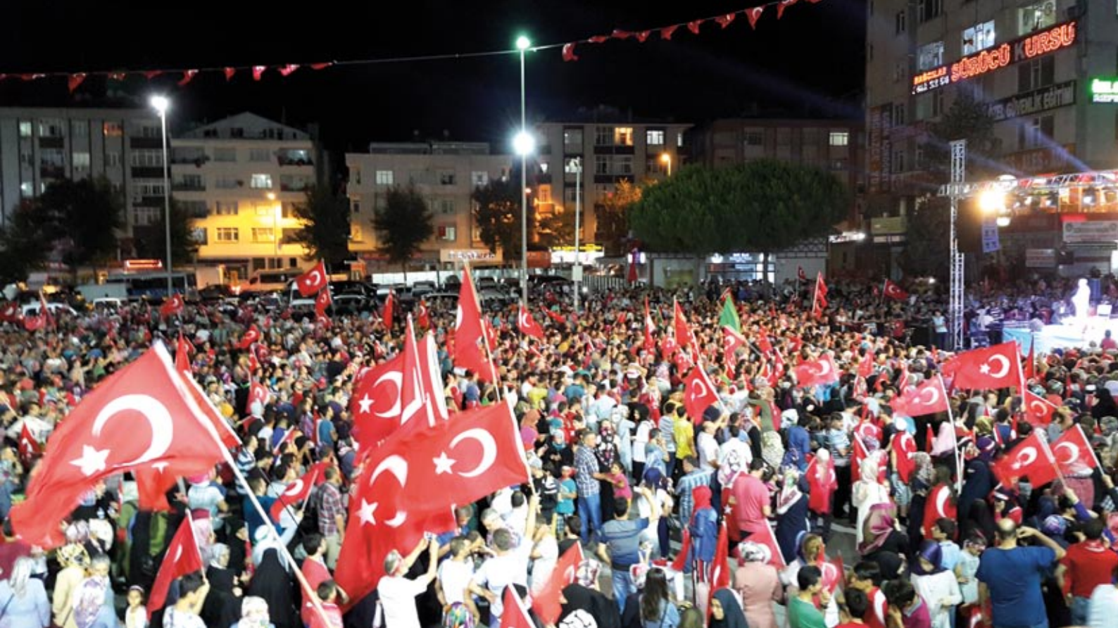
Turcy protestujący w Stambule przeciwko zamachowi stanu z 15 lipca 2016 roku.

wacja rozpoczęły budowę nowych oraz umacnianie dotychczasowych zasięgów na swych granicach zewnętrznych, jak i wewnątrzunijnych. W obecnej sytuacji perspektywa włączenia do strefy otwartych granic w ramach układu z Schengen Bułgarii, Rumunii oraz Chorwacji stała się o wiele bardziej odległa niż wydawało się to jeszcze rok czy 2 lata temu.