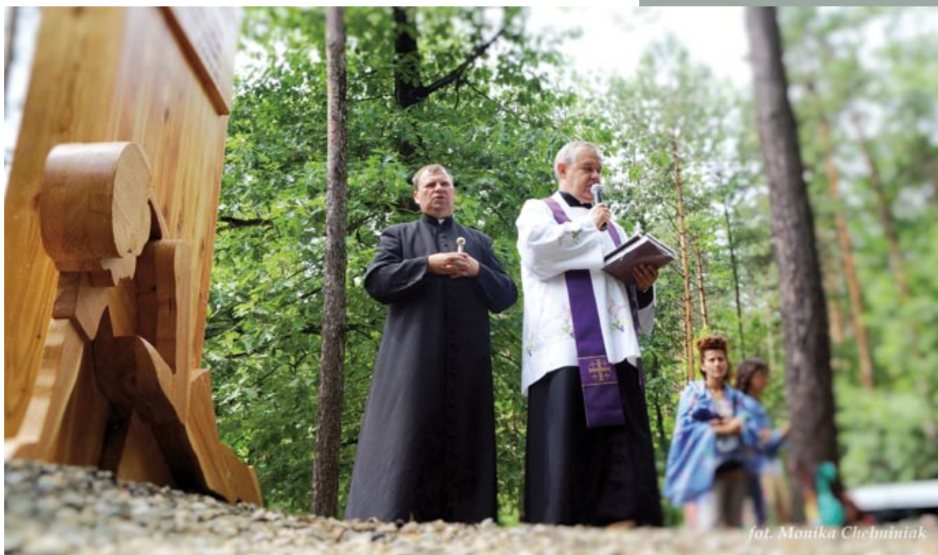
fot. Monika Chelminiak

Rypyras, rypyras i but ćhinas pał Porajmos dre Romano Atmo, isy dasave manusia kaj phenen kaj za but dałestyr phenas... Ale jame rovas ceło ćiro, dzi-ja jamare nacjake roven pał do jamare manusiendyr... Łokhi phuv łenge.