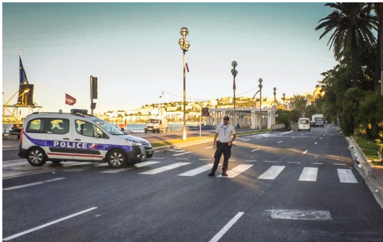
Policja pilnująca wjazdu na Promenadę Anglików w Nicei dzień po zamachu, w wyniku którego zginęło 86 osób, a ponad 200 zostało rannych.

Porozumienie o otwartych granicach w Europie z Schengen, częściowo zawiesiły jesienią 2015 r. Austria, Dania, Niemcy, Szwecja i Norwegia oraz Francja i Włochy, intensyfikując kontrole na granicach wewnątrzunijnych, zaś Słowenia, Węgry oraz Chor-