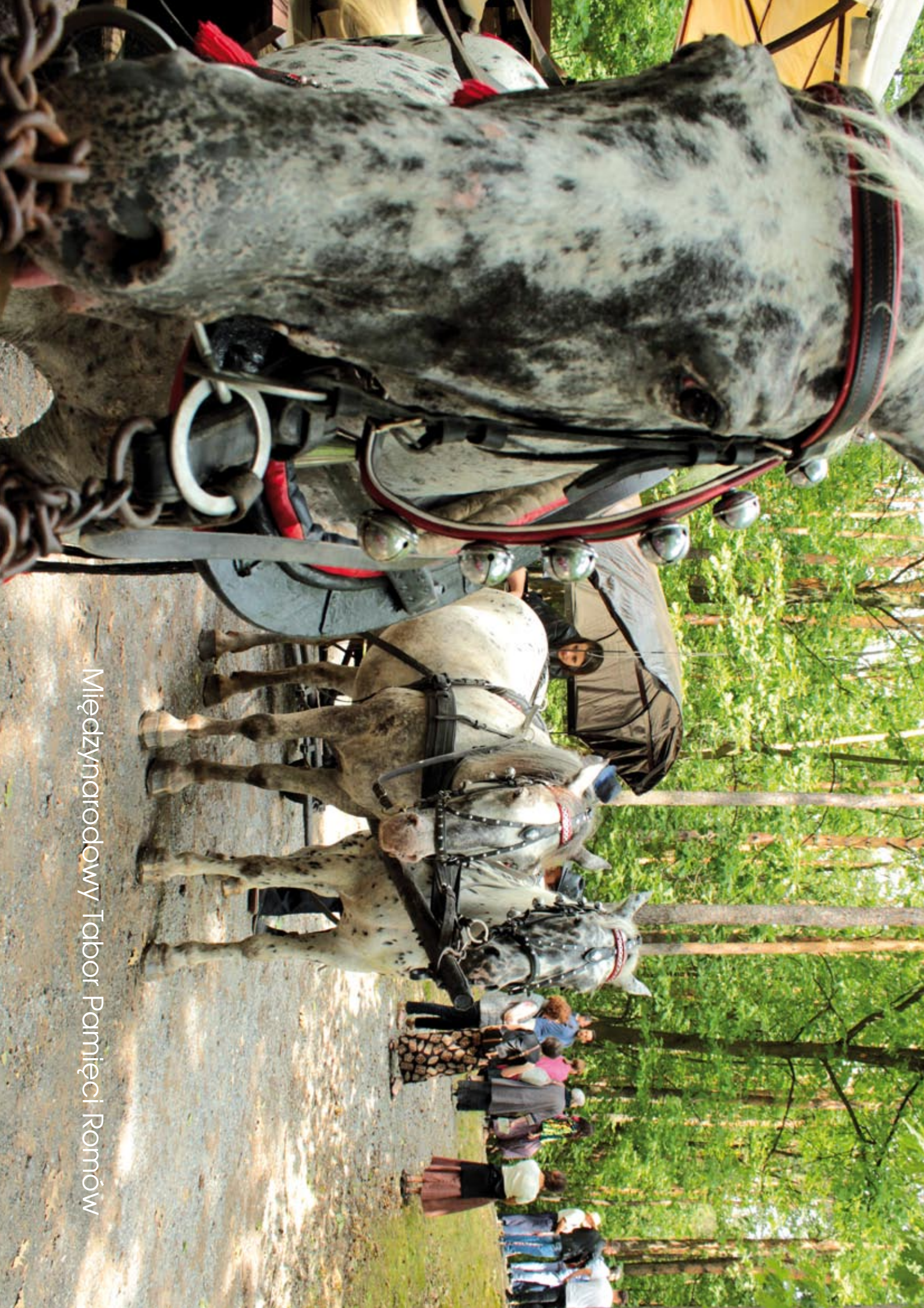
Międzynarodowy Tabor Pamięci Romów