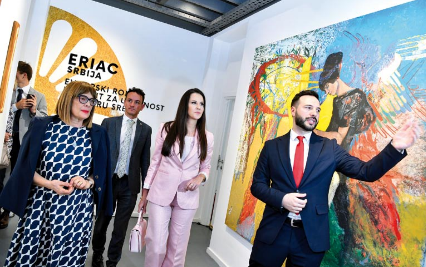
W Belgradzie ERIAC z okazji Międzynarodowego Dnia Romów zaprosił na wystawę „(Nie)widzialność – Romskie Strategie Samoreinterpretacji”. Wśród widzów pojawiły się m.in. Pierwsza Dama Serbii Tamara Vučić, Wicepremier i Minister Kultury Republiki Serbii Maja Gojković.

szonymi dyplomatami, uczczono Międzynarodowy Dzień Romów. Przebywający z tej okazji w Budapeszcie Szefer Departamentu Młodzieży Rady Europy Tobias Flessenkemper spotkał się uprzednio z przedstawicielem węgierskiego rządu oraz dyplomatami obecnymi na Węgrzech w celu dyskusji na temat priorytetów Rady Europy w sprawie włączenia Romów. Podkreślił przyjęte przez Komitet Ministrów Rady Europy Zalecenia w sprawie uczestnictwa młodzieży romskiej przy okazji oficjalnego tłumaczenia na węgierski, a także Zalecenia w sprawie równości kobiet i dziewcząt romskich .