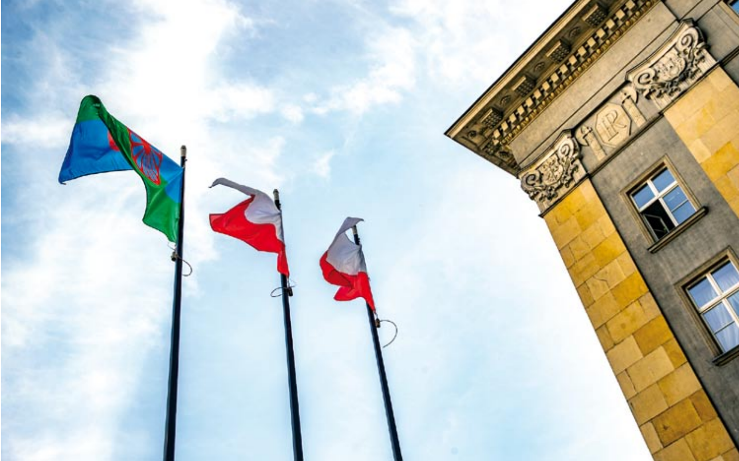
Romska flaga dumnie powiewała także przed siedzibą Śląskiego Urzędu Wojewódzkiego.

ka komunikacji Fundacji W Stronę Dialogu: „Podświetlenie Pałacu Kultury i Nauki w kolorach romskiej flagi to przełomowy gest solidarności ze społecznością romską, ale też wyraz postępującej emancypacji Romek i Romów. To wydarzenie historyczne w skali nie tylko Polski, ale też Europy. Stojący w samym centrum Warszawy PKiN został oświetlony romskimi barwami po raz pierwszy – nigdy wcześniej takie wydarzenie nie miało miejsca. Inicjatywa, która wyszła ze strony Fundacji W Stronę Dialogu, spotkała się z otwartością władz miasta. Dlatego z jednej strony możemy mówić o rosnącej sprawczości społeczności romskiej, która coraz odważniej działa na rzecz swojej wspólnoty, a z drugiej o wzroście świadomości władz lokalnych nt. konieczności podejmowania działań stawiających w centrum mniejszość romską. Liczymy na to, że władze innych miast wezmą przykład z Warszawy i w przyszłym roku 8 kwietnia, kiedy obchodzimy Międzynarodowy Dzień Społeczności Romskiej, do inicjatywy podświetlania kluczowych budynków w danych miejscowościach, dołączą inne miasta i miasteczka. O to będziemy z pewnością zabiegać”.