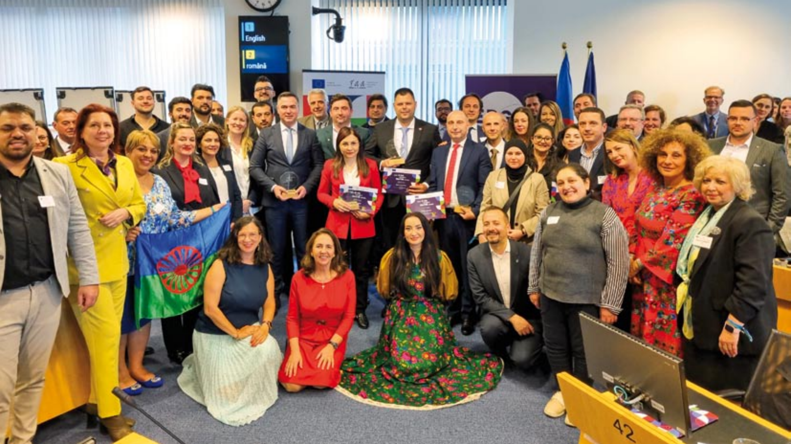
Uczestnicy Roma Week zebrali się wspólnie w budynku Europejskiego Komitetu Ekonomiczno-Społecznego.