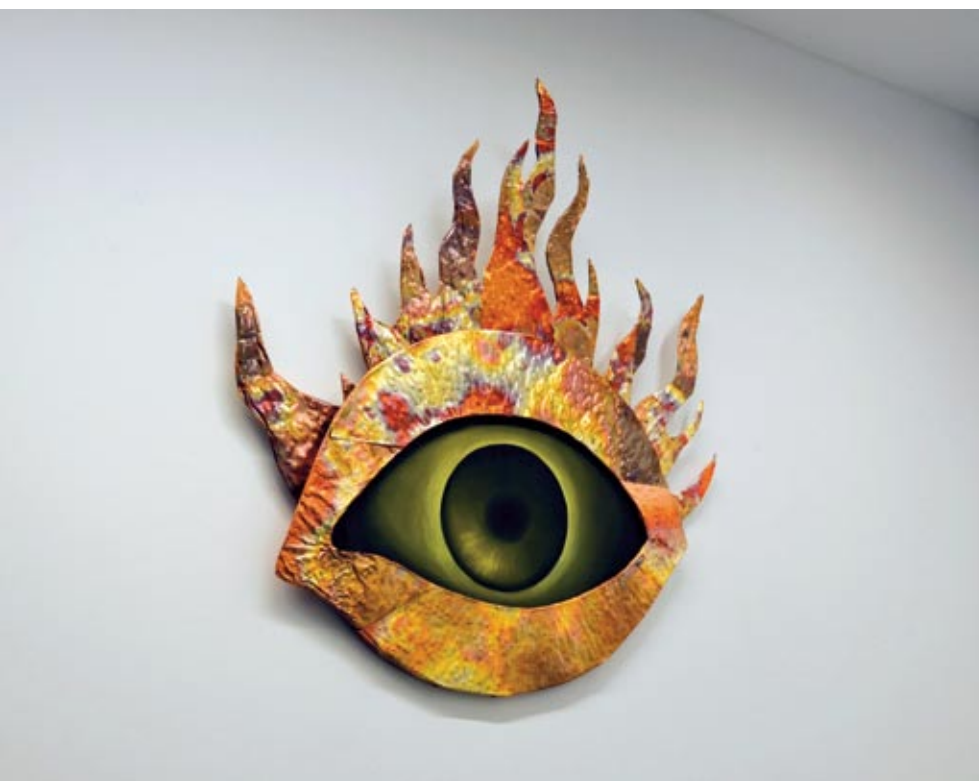
Obrazom towarzyszy „AkhaliBen”. Dwa takie dzieła artysta wykonał w miedzi i drewnie.

Postaci, które widz ogląda, czy to na obrazach prezentowanych na wystawie, czy to na zdjęciach z wystawy, są statyczne, nie kłębią się, nie stwarzają wrażenia