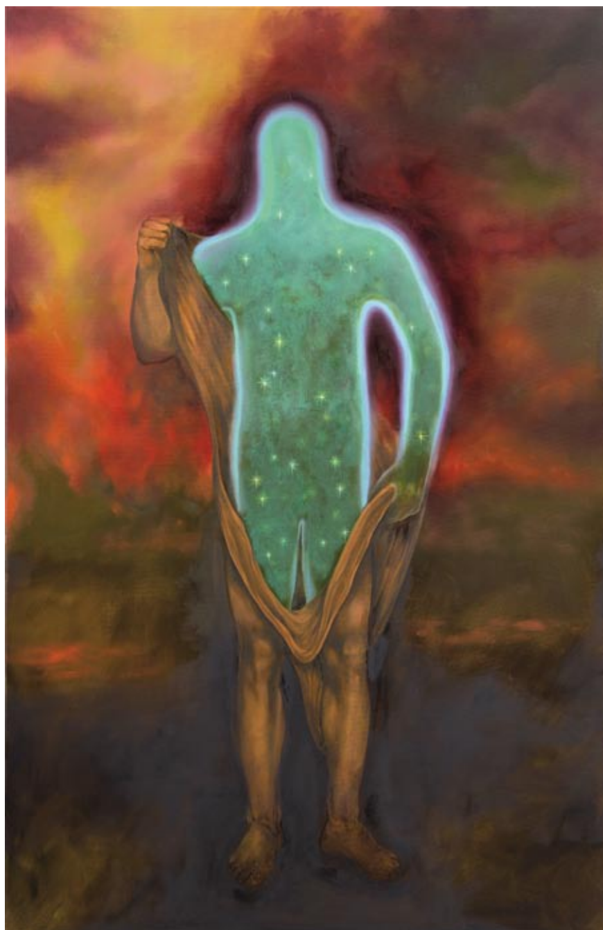
Krzysztof Gil, Gwiezdny pył , 2024, olej na płótnie.

Wystawę artysty można było podziwiać w Galerii MONOPOL w dniach od 17 lutego do 29 marca 2024 r.