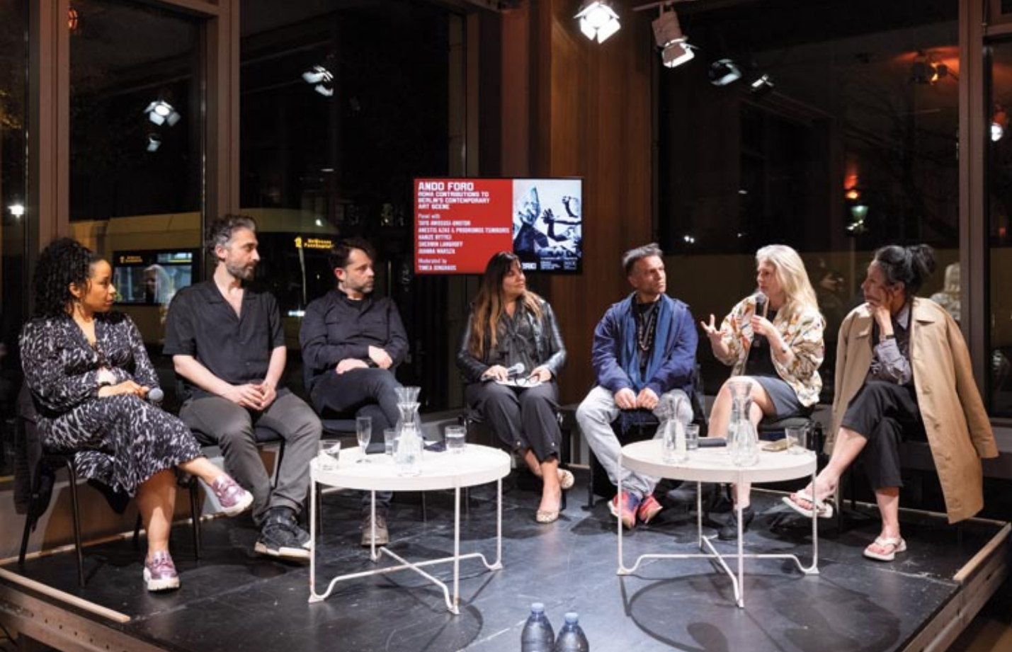
Berlińskie obchody, zorganizowane przez ERIAC, to oprócz prezentacji teatralnych, dyskusja, poświęcona wkładowi Romów w berlińską scenę sztuki współczesnej. Podczas panelu spotkali się wybitni twórcy teatralni, artyści, kuratorzy sztuki oraz inni przedstawiciele świata teatru.

dotyczące pomocy Państwa w zakresie podtrzymywania wartości kulturowych (art. 35), równości obywateli w zakresie praw i obowiązków oraz niedyskryminacji (art. 32), czy w Kodeksie karnym – zakażu dyskryminacji, rasizmu, czy stygmatyzacji (art. 118, art. 256, czy art. 257)”. Oświadczenie oświęcimskiego Stowarzyszenia kończy się wyrazami nadziei, że podczas kolejnych obchodów Międzynarodowego Dnia Romów będzie można powiedzieć, że dla władz publicznych Romowie są takimi samymi obywatelami, jak inni. Stowarzyszenie Romów w Polsce przypomniało również o powołaniu tak ważnej dla dziedzictwa romskiego instytucji, jaką jest Centrum Historii i Kultury Romów, z siedzibą w Oświęcimiu.