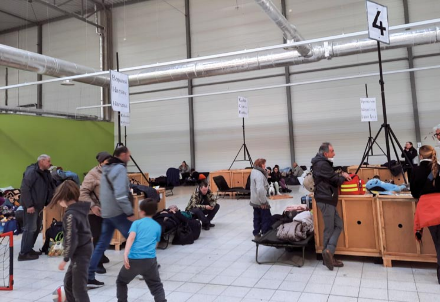
Warunki w punktach recepcyjnych, w których przebywali Romowie uciekający z Ukrainy, są nadal bardzo trudne. Jakby świat zapomniał, że też są uchodźcami, równie bezbronnymi i doświadczonymi wojną, jak Ukraińcy.

M.S.: Nie wiem, trudno mi powiedzieć. Szacuje się, że w pewnym momencie Romów z Ukrainy w Polsce było więcej niż polskich Romów. Jak do tej pory ja osobiście nie słyszałam. Myślę, jednak że w takich miejscowościach, gdzie są ośrodki, w których 90% a nawet i 100% stanowią Romowie i przebywa tam 100, 200 i więcej Romów ukraińskich może mieć wpływ na wizerunek Romów polskich, ale może też być na odwrót, że to stereotypy, niechęć wobec polskich Romów przerzuca się na ukraińskich Romów. Z drugiej strony, czy ma to znaczenie czy to Rom z Polski czy z Ukrainy myślę że nie, Rom to Rom.