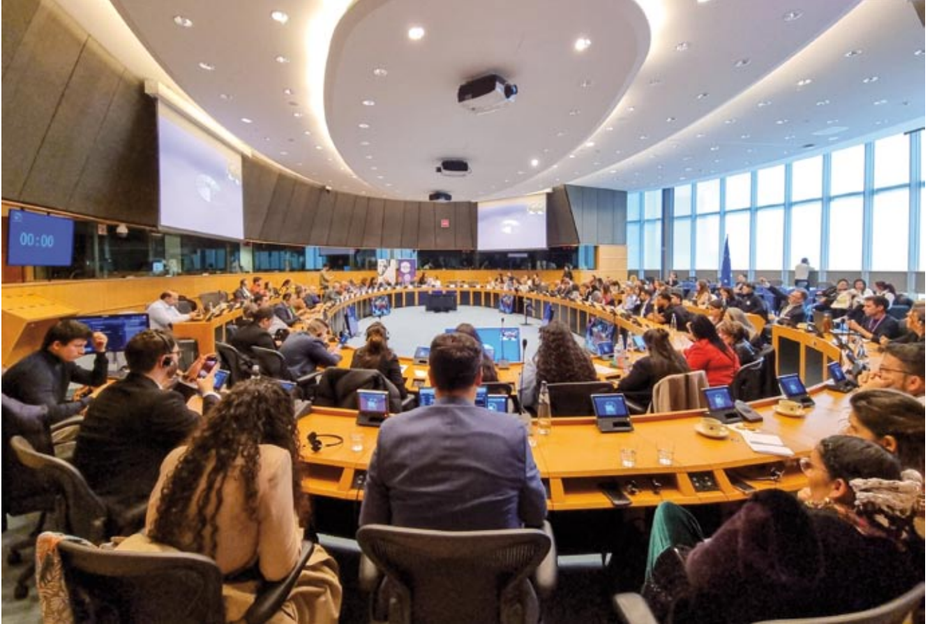
Jedną z ważniejszych sesji było spotkanie poświęcone 80. rocznicy Holokaustu Romów.

trum Europejskich Studiów Politycznych (CEPS), Europejski Sojusz Zdrowia Publicznego (EPHA), Instytut Demokracji Uniwersytetu Środkowoeuropejskiego (DI CEU).