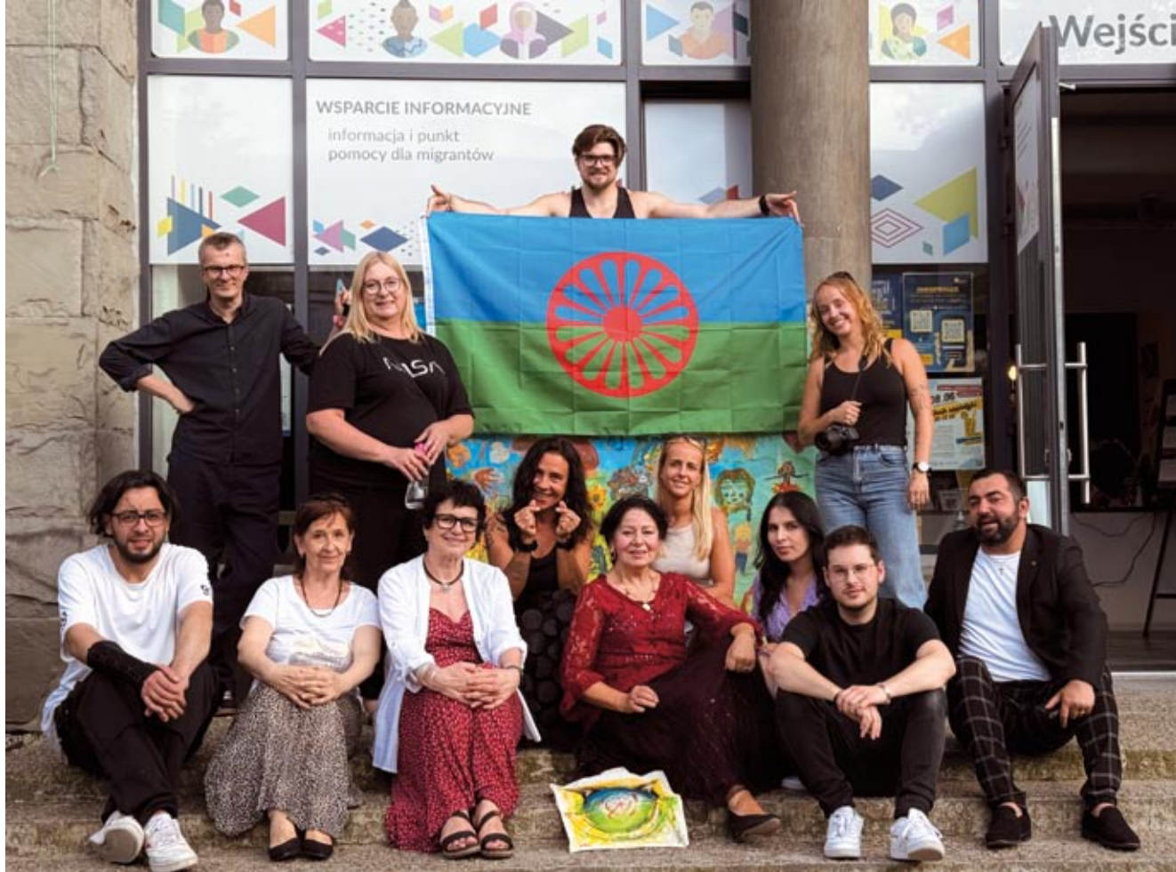
Organizatorzy i uczestnicy Wędrującego Festiwalu „Romani Kultura”: Warszawa 2024 – Bareforytka Roma.