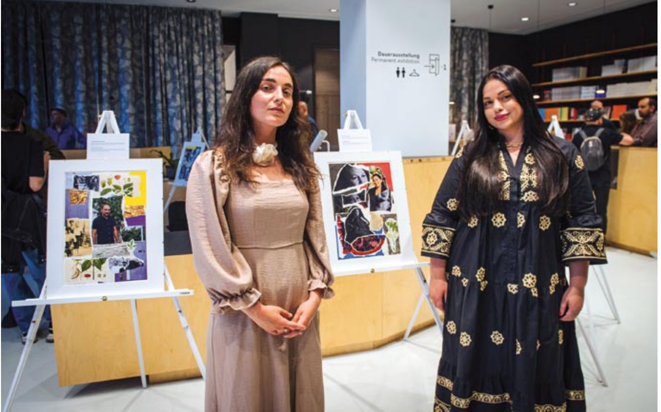
Tegoroczne obchody Dnia Oporu Romów uświetniło dwudniowe wydarzenie w Instytucie Pileckiego w Berlinie pod nazwą „Romowie w Ukrainie – wojownicy o demokrację, prawa człowieka i sprawiedliwość”. Inicjatywa obejmowała wystawę, dyskusję panelową oraz projekcję filmową.

Obchodzony dopiero od kilku lat Dzień Oporu Romów jest ważnym elementem budowania romskiej tożsamości narodowej i pamięci historycznej. Umożliwia on, współczesnym Romom, nie tylko upamiętnienie przeszłości, ale również wzmocnienie poczucia dumy i solidarności. Dzień ten jest również okazją do przypomnienia świata o ciągłych wyzwaniach i dyskryminacji, z jakimi mierzyła się i nadal mierzy romska społeczność oraz do promowania dialogu i zrozumienia międzykulturowego. Przy tej okazji nie mówi się tylko o przeszłości, ale również, w ramach różnych inicjatyw, podkreśla się pozytywne zmiany związane włączeniem Romów do społeczeństw w krajach ich zamieszkania. W tym roku znaczenie tego dnia miało jeszcze większą wagę nie tylko z racji okrągłej 80. rocznicy oporu Romów w Auschwitz-Birkenau, ale także z powodu dzisiejszej sytuacji ukraińskich Romów, którzy niestety nie są traktowani na równi z innymi ukraińskimi uchodźcami.