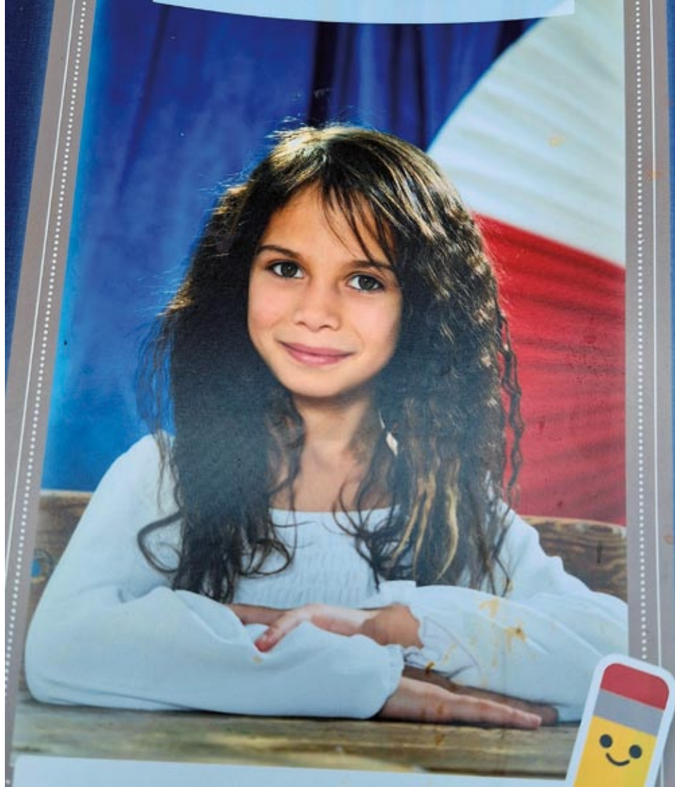
Wnuczka Wiktorii – pamiątka uroczystego ślubowania na ucznia w szkole, w Polsce.

A Ty w jaki sposób się angażujesz na rzecz uchodźców z Ukrainy, także rom-