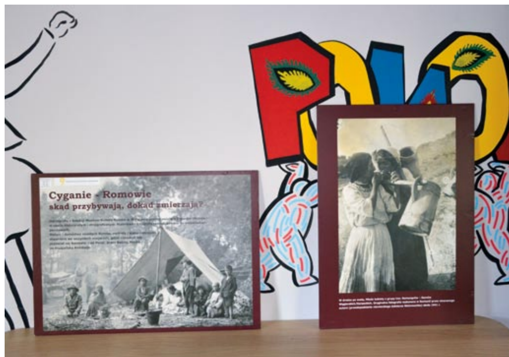
Część kącika etnograficznego prezentującego zbiory Muzeum Kultury Romów w Warszawie.

Tym biesiadnym akcentem zakończyła się tegoroczna edycja Wędrującego Festiwalu „Romani Kultura”. Odwiedzający festiwal mogli przekonać się, że romska kultura, to nie tylko taniec i śpiew, ale również malarstwo, sztuka czy poezja. „Nasi goście z wielkim zain-