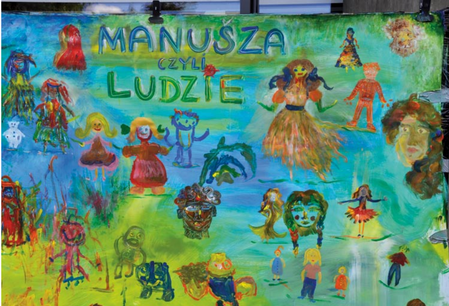
Efekt festiwalowych warsztatów malarskich „Manusza, czyli ludzie” autorstwa Noemi Łakatosz.

i prezentującego osiągnięcia Romów z różnych grup i w różnych miejscach zamieszkania. W roku 2024 gospodarzami Festiwalu stali się romscy działacze, artyści, twórcy kultury z Warszawy i województwa mazowieckiego, czyli Bareforytka Roma, co w romani oznacza Romowie z wielkiego miasta, czyli właśnie warszawscy Romowie”.