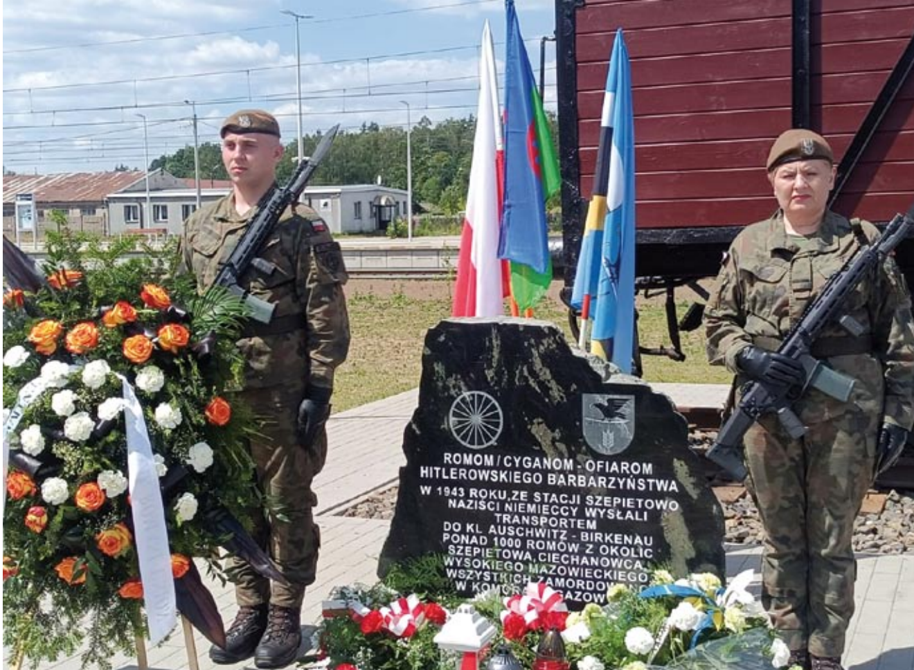
Tablica upamiętniająca Romów wywiezionych ze stacji kolejowej w Szepietowie do KL Auschwitz-Birkenau w 1943 r. Oficjalne odsłonięcie tablicy i pomnika odbyło się 16 czerwca 2024 r.

sięczne dziecko. Fakt odebrania życia, które zaledwie chwilę temu pojawiło się na tym świecie, przysparza o jeszcze bardziej dotkliwy ból serca.