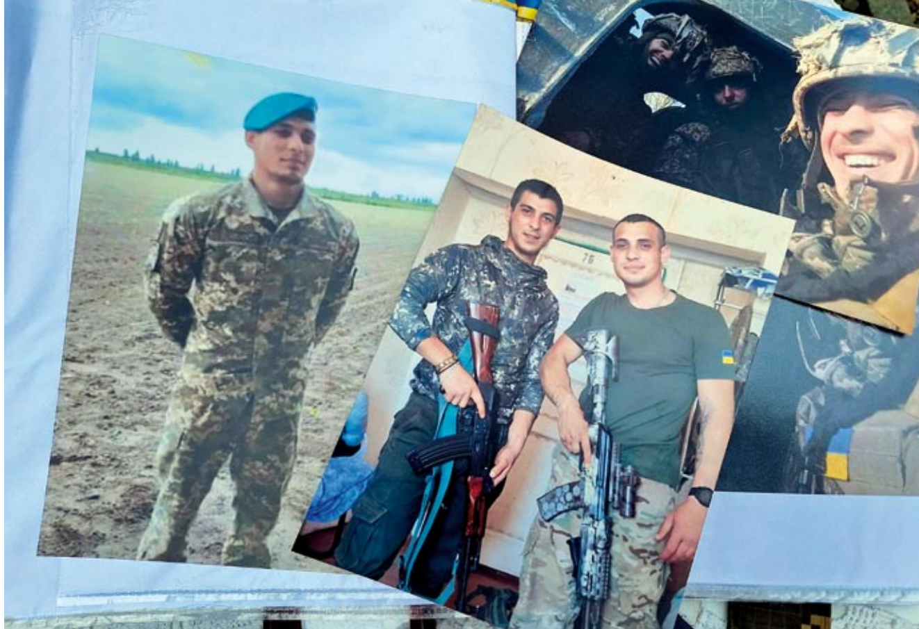
Synowie Wiktorii od 2018 r. roku walczą o wolność swojego kraju.

klepało bezmyślnie, bez emocji. Ich tam nie było w tych modlitwach. Nie modliło się z duszy. A modlitwa powinna płynąć z serca, od człowieka, powinna być wyrazem myśli, uczuć, tego co w człowieku jest. To nie może być tak, że ksiądz coś mówi, jakiś tam wierszyk i się go potem powtarza. To nie jest modlitwa, to są martwe słowa. I napisałam ten wiersz, on tak wypłynął mi spod ręki.