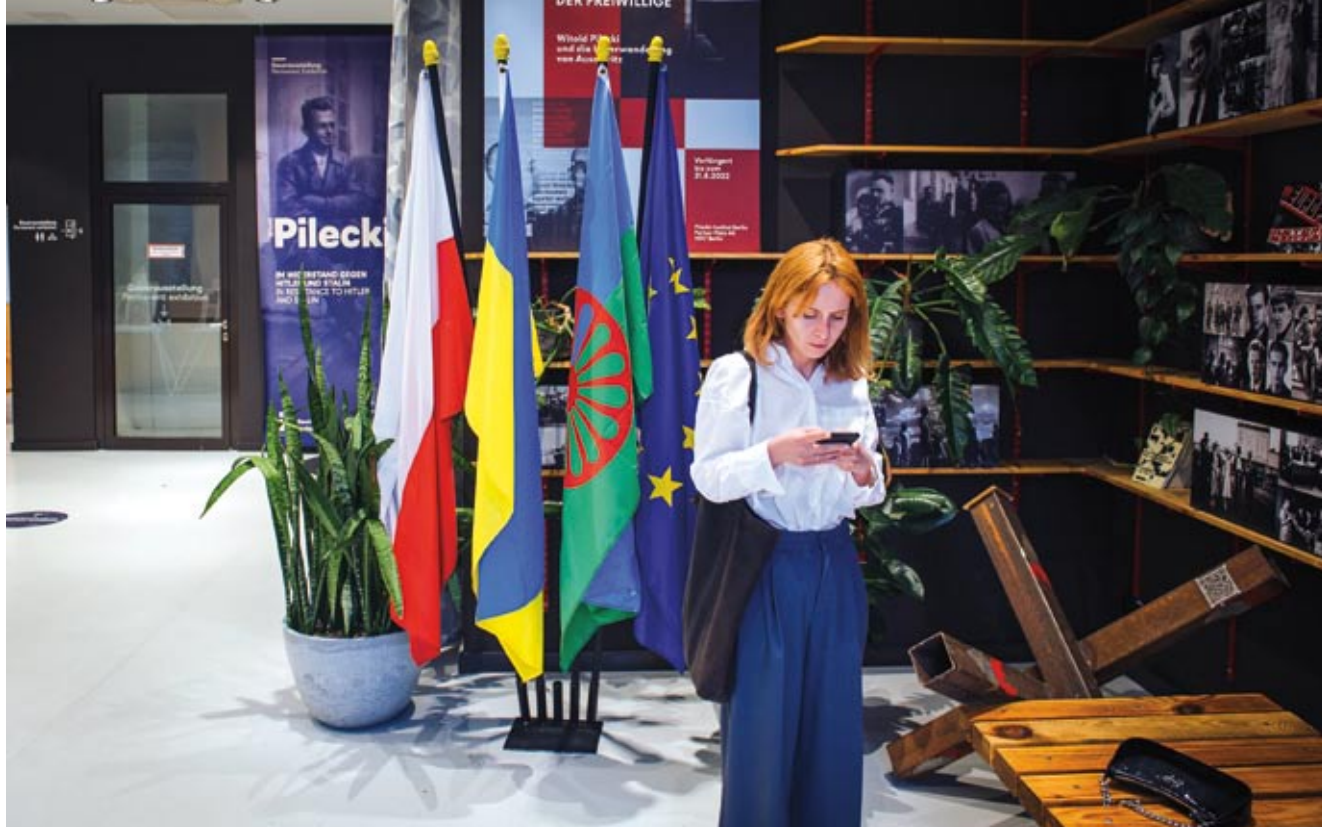
Flagi ustawione w szeregu: polska, ukraińska, romska oraz Unii Europejskiej, w połączeniu z aranżacją wnętrza siedziby Instytutu Pileckiego w Berlinie, emanowały duchem pamięci i szacunku dla historii i wspólnej walki o wolność i godność.