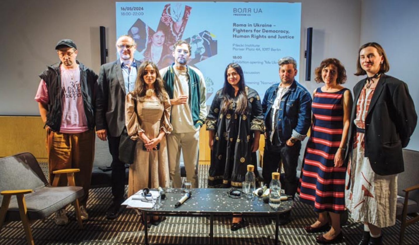
Prelegenci dyskusji „Romowie jako wojownicy o demokrację, prawa człowieka i sprawiedliwość – II wojna światowa i wojna Rosji z Ukrainą od 2014 roku” podczas pierwszego dnia wydarzenia w Instytucie Pileckiego w Berlinie, zorganizowanego w ramach obchodów Dnia Oporu Romów.

W tym roku jedną z najważniejszych inicjatyw związanych z obchodami Dnia Oporu Romów było dwudniowe wydarzenie w Instytucie Pileckiego w Berlinie pod nazwą „Romowie w Ukrainie – wojownicy o demokrację, prawa człowieka i sprawiedliwość”. Organizatorami inicjatywy, która obejmowała wystawę, dyskusję panelową oraz projekcję filmową byli: Instytut Pileckiego w Berlinie, Młodzieżowa Agencja Promocji Kultury Romskiej (ARCA), Centralna Rada Niemieckich Sinti i Romów, Stowarzyszenie Ludów Zagrożonych (STPI). Z kolei partnerami medialnymi byli: Europejski Instytut Sztuki i Kultury Romów (ERIAC) oraz Vitsche Berlin – organizacja reprezentująca diasporę ukraińską w Niemczech. Głównym tematem całej konferencji był czynny udział Romów w wojnie o niepodległość Ukrainy. Celem spotkania było właśnie rozpowszechnienie faktu, że ukraińscy Romowie również są na wojnie i jako obywatele Ukrainy chcą aby ich „dom” był wolny od najeźdźcy.